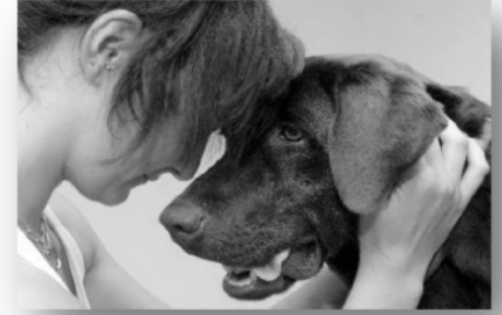
...und der Rest ist Kopfsache