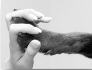
Wir arbeiten Hand in Hand